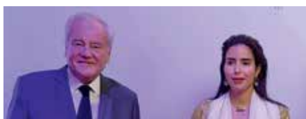
➤ Ambassadrice des ÉMIRATS ARABES UNIS S.E. Hend ALOTAIBA