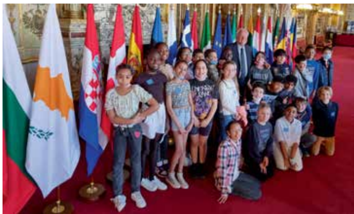
> Les élèves de CM2 de l'école Gravelle de SAINT-MAURICE .