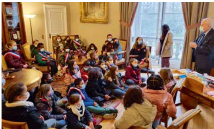
> Le Conseil Municipal des Enfants de LA QUEUE-EN-BRIE .