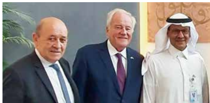
➤ Avec Jean-Yves Le Drian et le Ministre de l'Énergie, le Prince Abdul Aziz bin Salman.