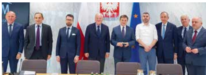
➤ Entretiens avec les parlementaires de la Diète et du Sénat à Varsovie.

Après le Brexit, la Pologne a une chance historique de déplacer le centre de gravité européen vers l'Europe Centrale. À elle de s'en saisir en respectant nos Traités ! La France à ses côtés pour des coopérations nouvelles dans les domaines de la Défense et de l'Énergie, une amitié solide, forgée dans l'Histoire, et qu'il faut encore développer !