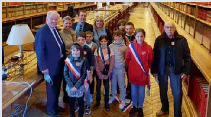
> Le Conseil Municipal des Enfants de PÉRICNY-SUR-YERRES .