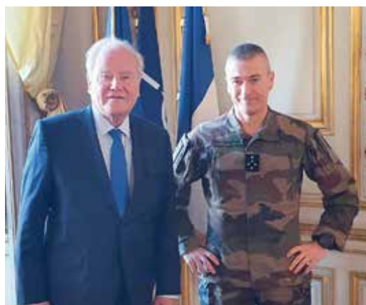
Général Thierry Burkhard, Chef d'État-Major des Armées