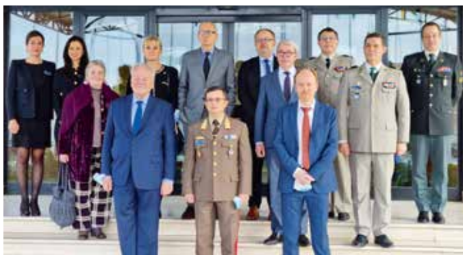
➤ Réunion de travail à l'OTAN de Rome.

Après le Covid, des liens renoués avec nos collègues italiens pour évoquer la situation en Méditerranée, théâtre de beaucoup d'affrontements menaçant notre propre sécurité. La coopération franco-italienne est essentielle notamment dans le domaine de la Défense.