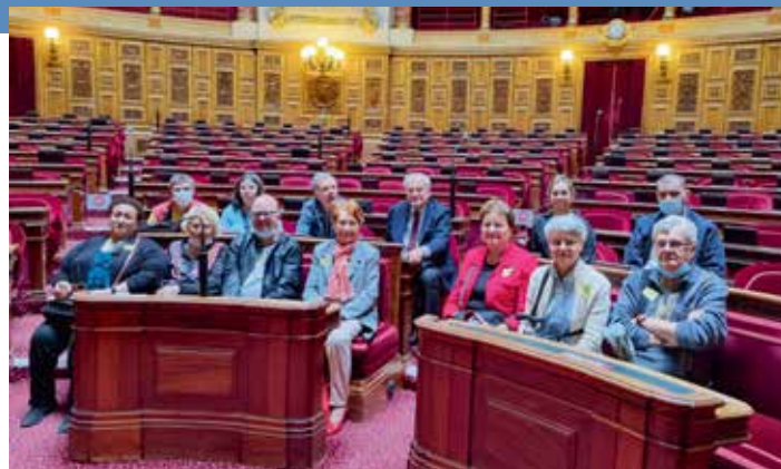
> L'Association Itinéraires et Rencontres de CRÉTEIL .