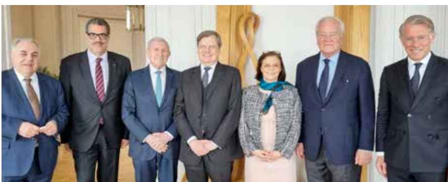
➤ Ambassadeurs d'Amérique latine :