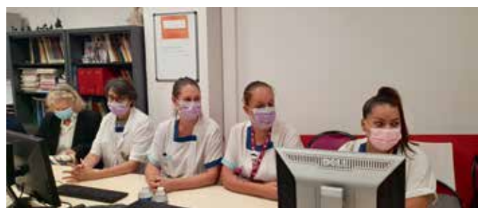
➤ Avec l'équipe des cancers de l'enfant.

Avec le Président Larcher, en visite de travail à l'Institut Gustave Roussy de Villejuif. Ce centre d'excellence de lutte contre le cancer vient de se hisser à la 3 e place des meilleurs centres anti-cancéreux du monde ! « Reconnaissance et soutien au corps médical mais aussi aux chercheurs qui chaque jour font avancer l'espérance de vie et de guérison des patients. » Le Sénat mobilisé pour cette grande cause nationale de Santé publique.