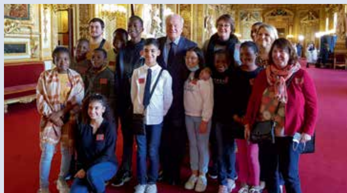
> Le Conseil Municipal des Enfants de CHOISY-LE-ROI .