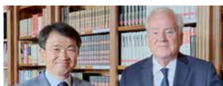
➤ Ambassadeur de CORÉE S.E. Dae-jong YOO