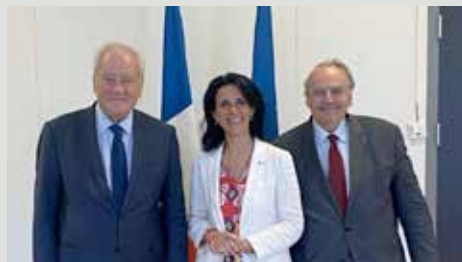
Avec Chrysoula Zacharopoulou, Secrétaire d'État auprès de la Ministre de l'Europe et des Affaires étrangères, chargée du Développement, de la Francophonie et des Partenariats internationaux et Jean-Louis Bourlanges, Président de la Commission des Affaires étrangères à l'Assemblée nationale.