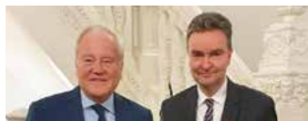
➤ Ambassadeur de HONGRIE S.E. Georges HABSBURG- LORRAINE