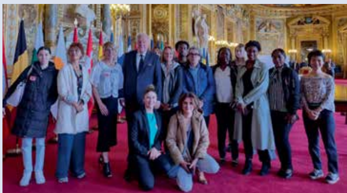
> Les apprentis de l'école de coiffure Élysées Marbeuf de JOINVILLE-LE-PONT .