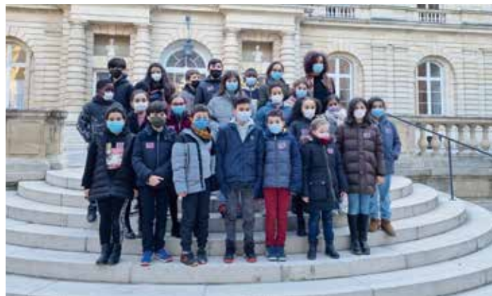
> Les élèves de CM2 de l'école élémentaire Robert Desnos de CHARENTON .