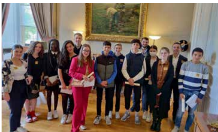
> Le Conseil Municipal des Jeunes de RUNGIS .