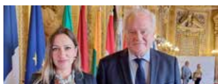
➤ Ambassadrice de BOSNIE-HERZEGOVINE S.E. Bojana KONDIC