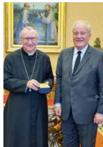
➤ En audience privée avec S.Exc. Mgr Gallagher, Secrétaire pour les Affaires extérieures, puis avec Son Éminence le Cardinal Pietro Parolin Secrétaire d'État du Pape.