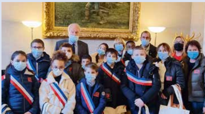
> Le Conseil Municipal des Jeunes de MANDRES-LES-ROSES .