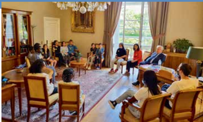
> Le Conseil de la vie Collégienne du Collège Paul Vaillant Couturier de CHAMPIGNY .