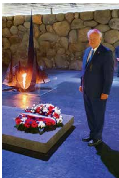
➤ Émouvante visite au Mémorial de Yad Vashem, pour se souvenir des 6 millions de victimes de l'holocauste avec le dépôt de gerbe au Monument des 1 600 000 enfants qui ont péri dans les camps nazis.