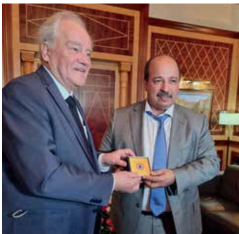
➤ Échanges avec M. Enaam Mayara, Président de la Chambre des Conseillers (Sénat marocain).