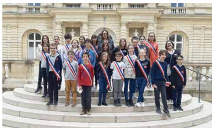
> Le Conseil Municipal des Enfants de RUNGIS .