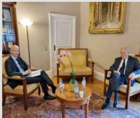
Avec Franck Riester, Ministre des Relations avec le Parlement.