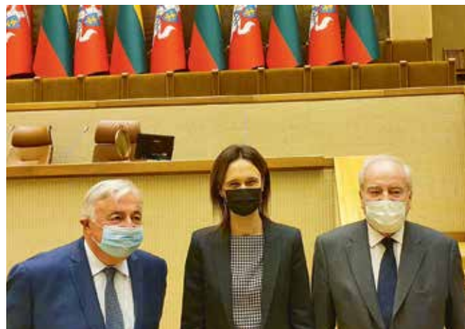
➤ Aux côtés du Président Larcher pour un entretien avec la Présidente du Sénat, Mme Viktorija Čmilytė-Nielsen et leurs Collègues du Parlement Lituanien.

Menacée par ses voisins russe et biélorusse, la Lituanie a une position stratégique au cœur des Pays baltes. La visite du Président Larcher a été particulièrement appréciée par les Dirigeants lituaniens.