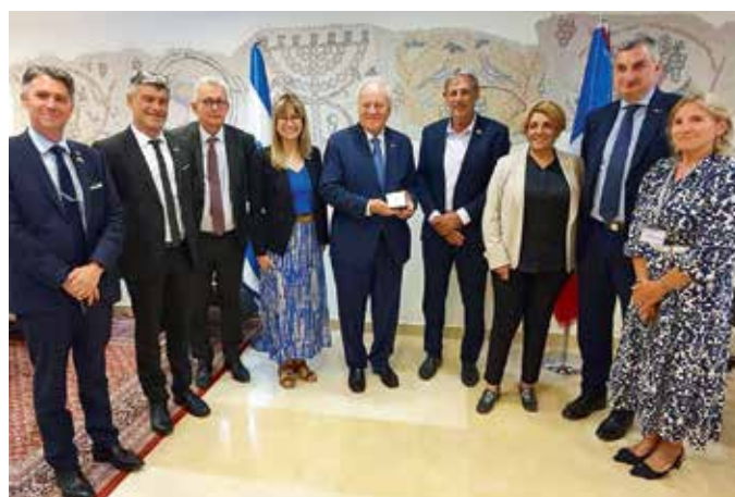
➤ Entretien à la Knesset au moment où celui-ci allait voter sa propre dissolution.