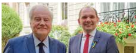
➤ Ambassadeur de LITUANIE S.E. Nerijus ALEKSIEJUNAS