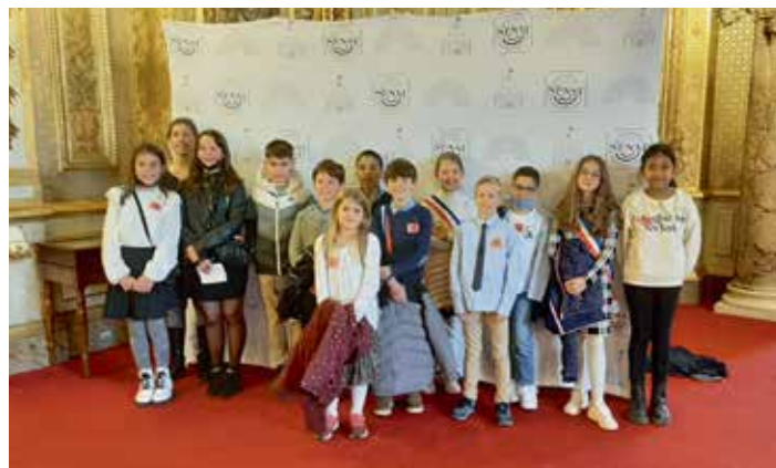
> Le Conseil Municipal des Enfants de MAROLLES-EN-BRIE .