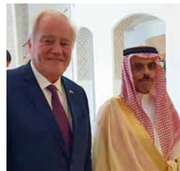
➤ Avec S.A.R le Prince Faïçal al Farhane, Ministre des Affaires étrangères.

Avec le Ministre des Affaires étrangères, Jean-Yves Le Drian, pour une reprise du dialogue avec ce pays essentiel à la stabilité de cette région. Même si nous ne partageons pas toujours les mêmes valeurs, la coopération avec l'Arabie Saoudite est essentielle pour calmer les tensions dans la région.