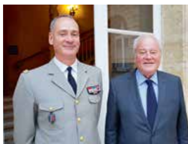
➤ Général Pierre Schill, Chef d'État-Major de l'Armée de Terre