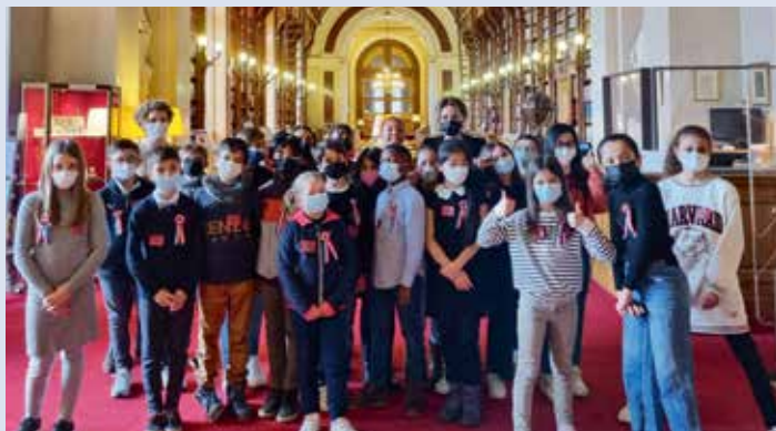
> Le Conseil Municipal des Enfants d' ORMESSON-SUR-MARNE .