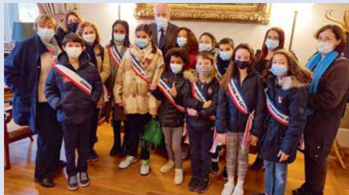
> Le Conseil Municipal des Enfants de VILLENEUVE-LE-ROI .