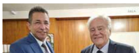
➤ Ambassadeur de CUBA S.E. Otto VAILLANT FRÍAS