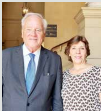
Avec Catherine Colonna, Ministre de l'Europe et des Affaires Étrangères.