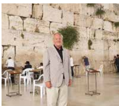
➤ Devant le Mur des Lamentations, dernier vestige du Temple de Salomon, détruit en 70 avant Jésus-Christ sur ordre de l'Empereur Titus. Tous les symboles des tensions au Moyen-Orient sont là, indissociables... Puissent-ils un jour devenir des lieux d'une Paix partagée !