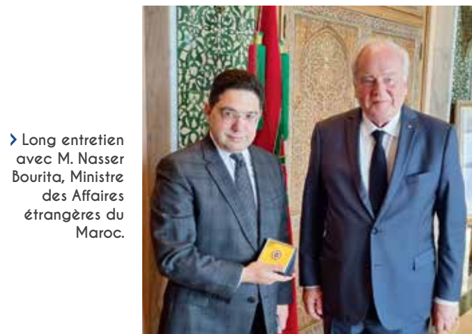
➤ Long entretien avec M. Nasser Bourita, Ministre des Affaires étrangères du Maroc.