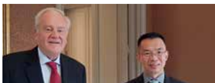
➤ Ambassadeur de CHINE S.E. Lu SHAYE