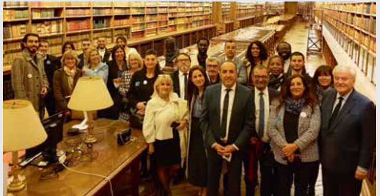
Le Conseil municipal de VALENTON et son MAIRE METIN YAVUZ.